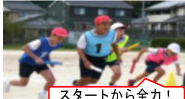
スタートから全力！

島田川学園では、「他校の子と一緒に競技することで、お互いに大きな刺激を与え合ってほしい。」との願いのもと、令和6年度から4校（三井・周防・上島田・島田小）すべてがそろっての合同開催へとその思いを広げてきました。