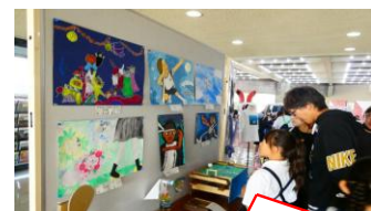
子どもたちの作品も多数展示！

昨年は雨の中でのバザーでしたが今年は好天！会場には、4年生のご家族や中学生の姿も多く、わたがしや焼きそば・うどんに列ができ賑わっていました。「焼きそば」は「おやじの会」が出店。実は、「おいしい」と評判でイベントでは引っ張りだことか…。島田の文化を感じるふれあいの一日をありがとうございました。