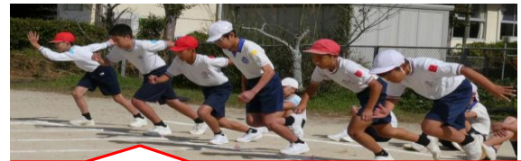
全員参加の60m走！意欲みなぎるスタート！