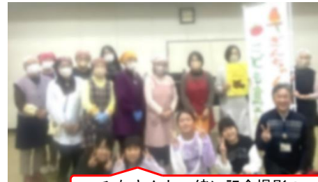
みなさんと一緒に記念撮影!

つだいも楽しみながらしてくれる子どもたちを見て、地域ボランティアの方々の思いが子どもたちにつながるまたとない機会だと感じた次第です。この日はカレーライス。いつもの2倍の200食を用意。作ってくださった方々の笑顔も想像しながらおいしくいただきました。皆さんありがとうございました。