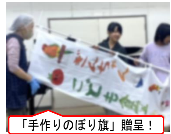
「手作りのぼり旗」贈呈!

多く見られうれしく思いました。さて、コンサートの後には、11月の「しまりんフェスティバル」のお礼にと給食委員会をはじめとした児童が駆けつけ、お礼のお手紙と手作りのぼり旗を贈呈いたしました。皆さんに喜んでいただけて子どもたちもうれしそう! その後は、お弁当やおやつ・飲み物やチラシなどを配るお手