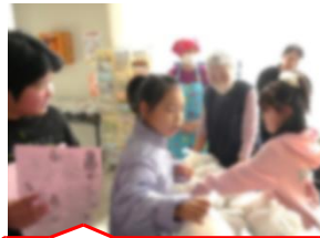
子どもたちがお手伝い!

つだいも楽しみながらしてくれる子どもたちを見て、地域ボランティアの方々の思いが子どもたちにつながるまたとない機会だと感じた次第です。この日はカレーライス。いつもの2倍の200食を用意。作ってくださった方々の笑顔も想像しながらおいしくいただきました。皆さんありがとうございました。