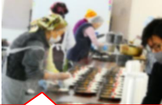
地域ボランティアの方々がお心を込めてお弁当作り!

」さんの「アベ・マリア」。さんの「アベ・マリア」。さすが宝ジュエヌです。毎年12月に開催くださっているイベントですが、今年は会場に人があふれ、入りきれなかったので何度も何度も椅子を補充しなければならぬほどの大盛況。子どもたちの姿も