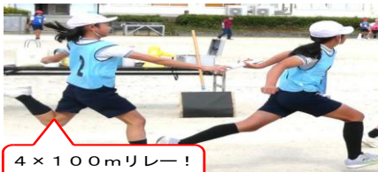
4 × 100mリレー！ 思いをつなぐ！

島田川学園では、「他校の子と一緒に競技することで、お互いに大きな刺激を与え合ってほしい。」との願いのもと、令和6年度から4校（三井・周防・上島田・島田小）すべてがそろっての合同開催へとその思いを広げてきました。