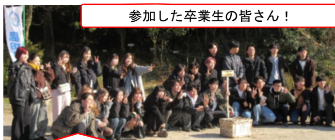
参加した卒業生の皆さん！

卒業生が小学生時代から関わってくださっている方がたくさん！卒業生は久々に交友を深め、連絡先を交換しワイワイとみんな楽しそう！「会えてよかった！」「これからもがんばろうね！」と励まし合う卒業生を見ていてこの会の意義深さを感じました。旧友や恩師との再会と企画したおやじ会のみなさんの思いは、卒業生のこれからの人生への大きなエールになるにちがいありません。