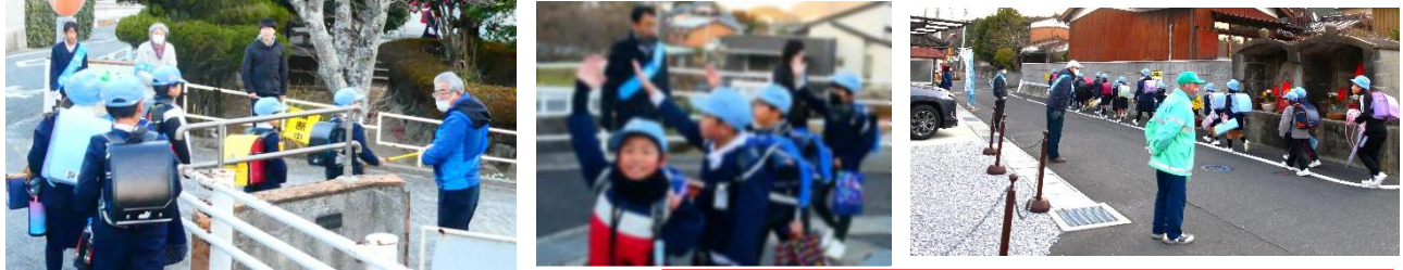
地域ボランティアの方がマンツーマンで！

登校初日の1月8日以降、寒波の到来で寒い日が続いています。そんな中、多くの地域・保護者の方が「あいさつ運動」を展開。運営委員会児童も加わって、凍てつく朝に心温まるあいさつがこだましていました。大きな声であいさつを交わせば体も温くなるから不思議です。おかげで子どもたちもエネルギー充填完了！笑顔で校門をくぐっていました。ご協力いただいたみなさん、ありがとうございました。