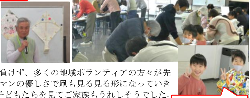
子どもたち楽しそう！

12月14日（日）、たこづくり講習会（青少年健全育成島田地区会議主催）が島田コミュニティセンターで開催されました。今年、な、なんと30名の希望があり、会場は大盛況。子どもの数に負けず、多くの地域ボランティアの方々が先生役に！丁寧なご指導とマンツーマンの優しさで凧も見見る形になっていきます。日本伝統の凧作りに夢中な子どもたちを見てご家族もうれしそうでした。