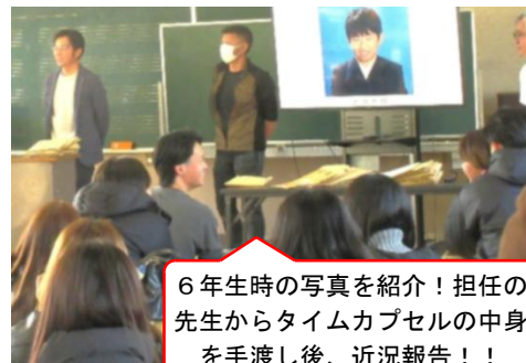
6年生時の写真を紹介！担任の先生からタイムカプセルの中身を手渡し後、近況報告！！