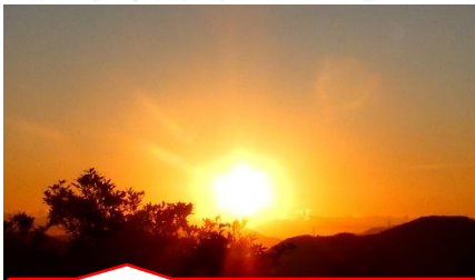
令和8年 鶴羽山から望む初日の出！

新しい年を迎え、ひと月が経とうとしています。島田にお住いの皆様、改めまして、今年もよろしくお祈りいたします。