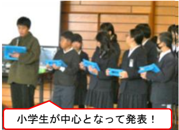
小学生が中心となって発表！

12月26日（金）、朝から雪が舞う極寒の日に、島田中校区の4つの小学校5・6年生有志と島田中新旧生徒会役員が集まり、「島田川っ子サミット」を開催。本校からも希望者計15名が参加して熱い議論を交わしました。今回のテーマは3つ。まずはこれまで「島田川学園」で取り組んできた「学力向上（家庭学習）」を中心に各校や個人の取組成果を紹介。続いて新たなテーマとして「委員会活動」を中心とした取組と課題点について共有。3つめのテーマとして子どもたちが直面する「メディア」に関する課題を子どもたちなりに危機感を持って話し合うことができました。今回は中学3年生の生徒も