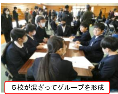
5校が混ざってグループを形成

12月26日（金）、朝から雪が舞う極寒の日に、島田中校区の4つの小学校5・6年生有志と島田中新旧生徒会役員が集まり、「島田川っ子サミット」を開催。本校からも希望者計15名が参加して熱い議論を交わしました。今回のテーマは3つ。まずはこれまで「島田川学園」で取り組んできた「学力向上（家庭学習）」を中心に各校や個人の取組成果を紹介。続いて新たなテーマとして「委員会活動」を中心とした取組と課題点について共有。3つめのテーマとして子どもたちが直面する「メディア」に関する課題を子どもたちなりに危機感を持って話し合うことができました。今回は中学3年生の生徒も