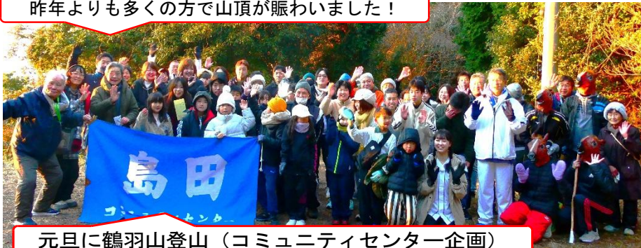
元旦に鶴羽山登山（コミュニティセンター企画）

創立152年となる島田小学校も、子どもたちを中心に、ご家族・地域のみなさんにとっても「楽しさあふれる学校」としていけるよう、活力をもって努めて参りますのでご協力のほどよろしくお願いいたします。