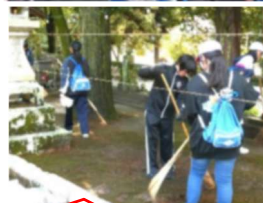
熊野神社の境内も！