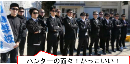
ハンターの面々！かっこいい！

2月21日（土）、待望の「逃走中」（いわゆる鬼ごっこ）を開催！昨年到现在第2回目です。今回は参加者80名超え！ハンターも、写真の通りやる気満々。隠れる場所も盛りだくさんなので、子どもたちに有利？と思いきや、いざ始まるとハンターの挟みうちなどに苦戦