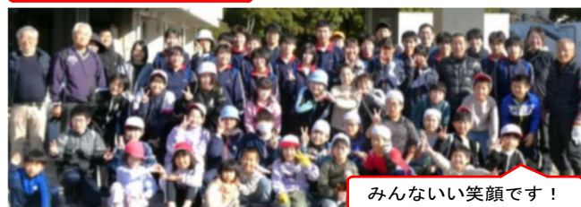
みんないい笑顔です！

めのことばも！同じ時間帯には、中島田コミュニティセンターや、上島田小・三井小・周防小校区でも「ピカピカデイ」を実施。お休みの日に「島田のために」働こうと行動してくれた皆さんの心が何より嬉しかったです。来年もぜひ参加してくださいね。