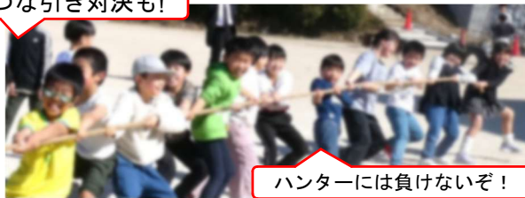
ハンターには負けないぞ！

じました。「おやじの会」「島田コミュニティセンター」の皆様、子どもたちのために、こんなに楽しい企画を本当にありがとうございました。