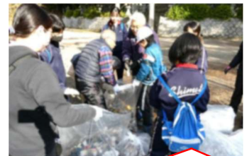
最後にゴミの集積・分別も！