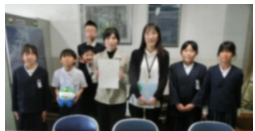
福祉委員会児童が募金を手渡しました

先週は、緑の募金にご協力いただき、ありがとうございました。おかげさまで、5,311円の募金が集まりました。27日に光市緑化推進協議会の方にお渡ししました。光市の緑化活動に役立てていただきます。